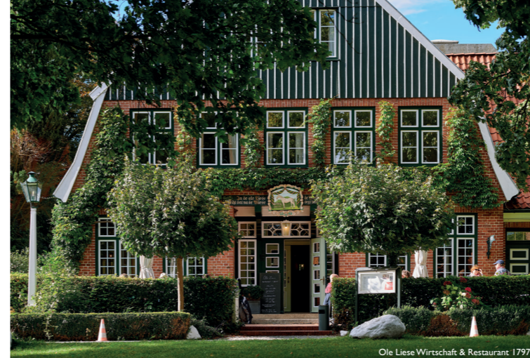
Ole Liese Wirtschaft & Restaurant 1797